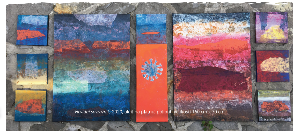
Nevidni sovražnik, 2020, akril na platnu, poliptih velikosti 160 cm x 70 cm