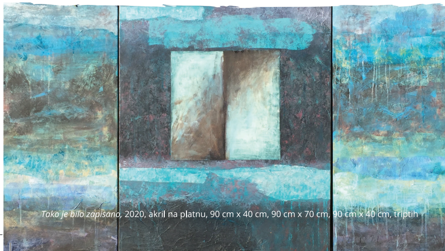
Tako je bilo zapisano, 2020, akril na platnu, 90 cm x 40 cm, 90 cm x 70 cm, 90 cm x 40 cm, triptih

*Besedilo se na nekaterih delih naslanja na tekste avtoric Monike Lazar in Anamarije Stibilj Šajn.