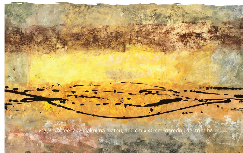
Vse je ciklično, 2020, akril na platnu, 100 cm x 40 cm, osrednji del triptiha