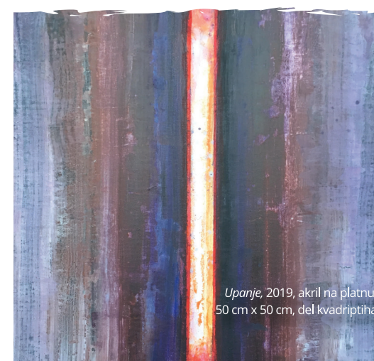
Upanje, 2019, akril na platnu, 50 cm x 50 cm, del kvadriptiha